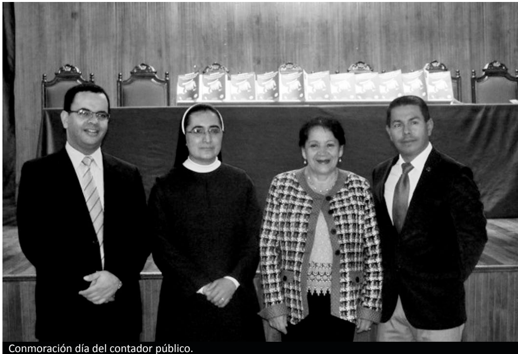
Comemoración día del contador público.

Teniendo en cuenta que en la actualidad la profesión contable en Colombia y en el mundo enfrenta nuevos retos impuestos por las dinámicas de un mercado abierto, y por tanto, la comunidad contable debe responder a las nuevas exigencias, las conferencias que se centraron en los retos de la profesión contable,